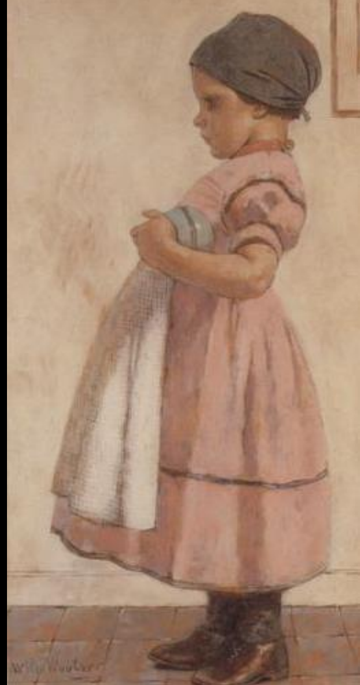
Meisje met Bal Wilm Wouters