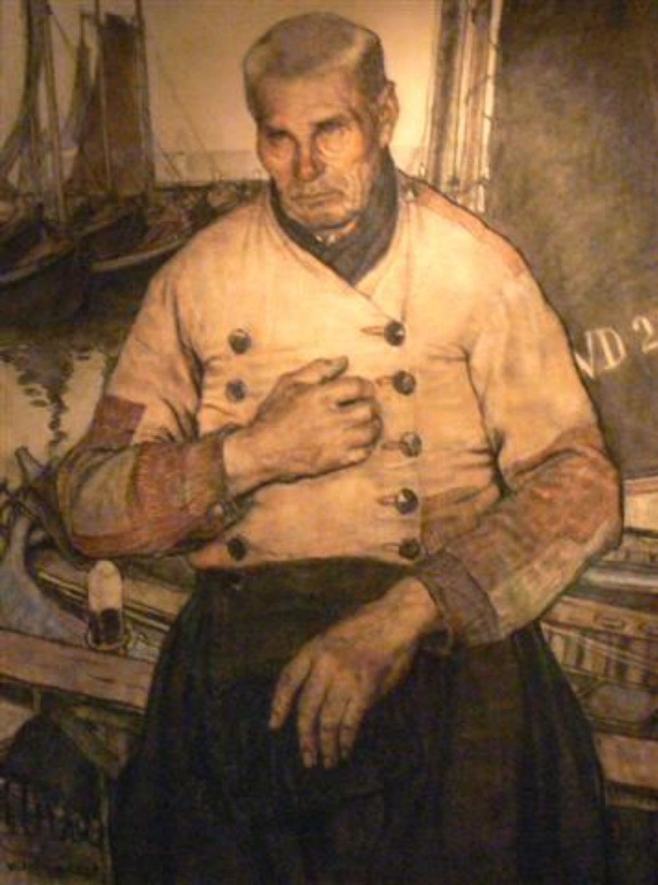
Wilm Wouters-1923 Het Angelus