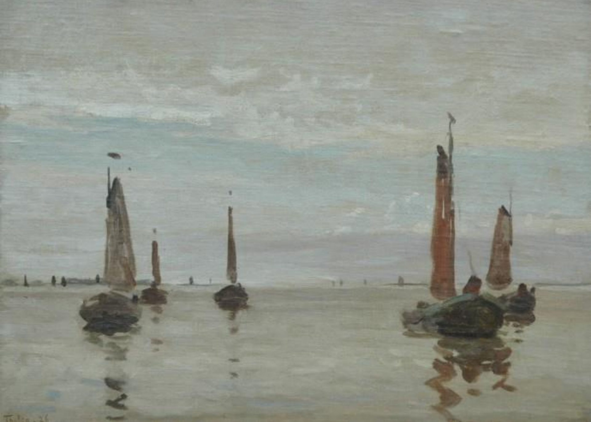
W. Tholen - Botters in een Windstilte 1926