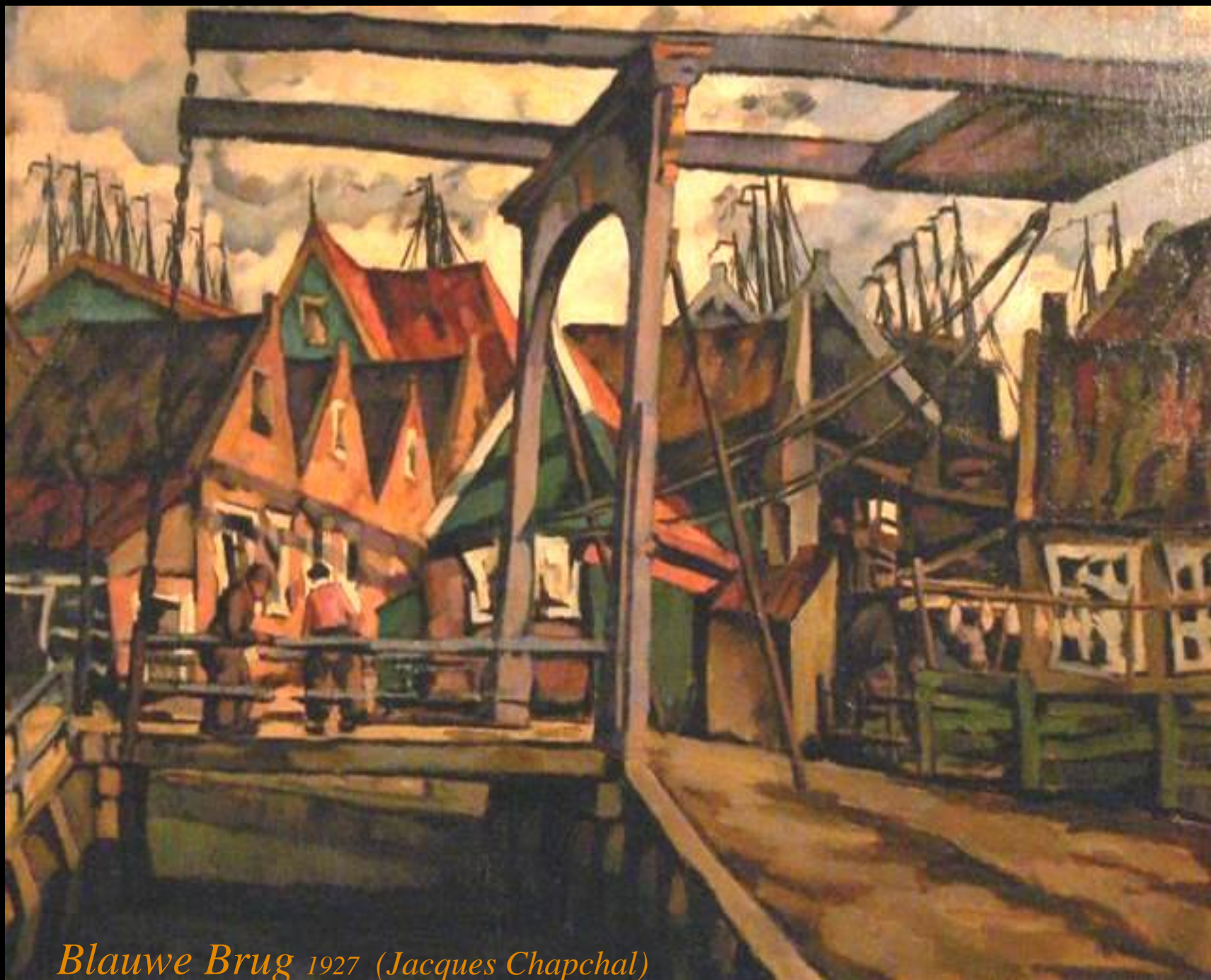
Blauwe Brug 1927 (Jacques Chapchal)