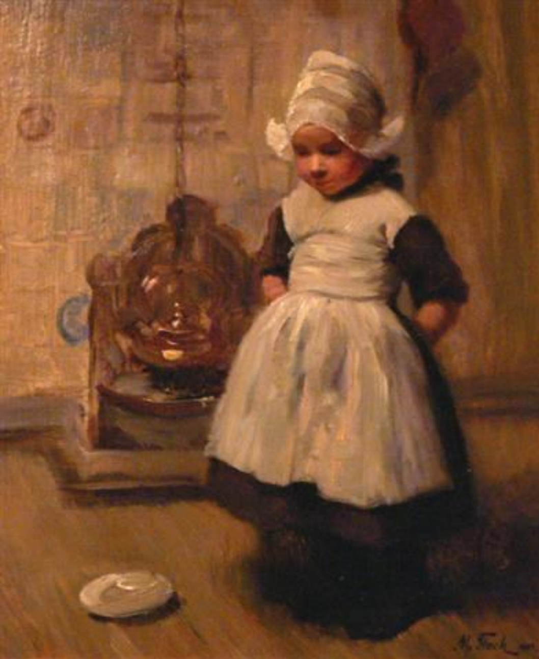
Meisje voor Schouw