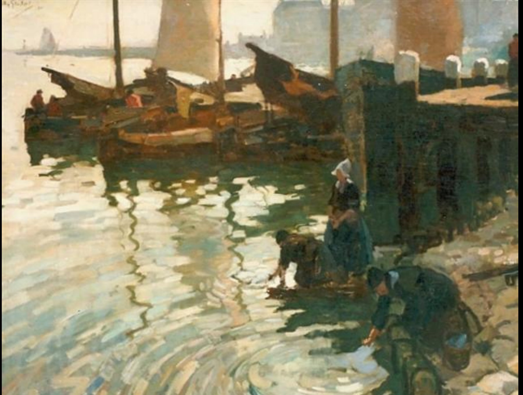
Willy Sluiter Wassende Vrouwen in de Haven van Volendam 1910